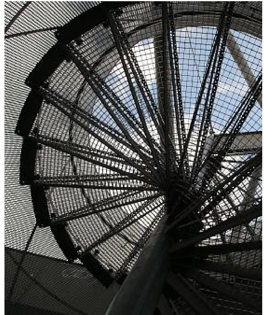
Trap Tetraeder Bottrop

‘Der Himmel über der Ruhr muss wieder blau werden’, zei Willy Brandt in 1961, op verkiezingstournee in Dortmund, jaren voordat hij bondskanselier zou worden. Het heeft even geduurd. ‘Zo helder zagen we het nog nooit’, zeggen twee Duitsers op het platform van de Tetraeder. Uit een koeltoren wellen witte wolken op. De idylle laat zich niet verstoren. ‘Dit moet waterdamp zijn.’