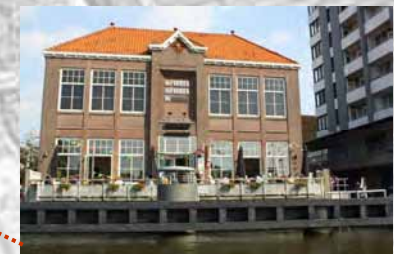
Cafe de Fabriek