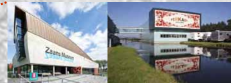
Zaanse Museum en Verkadepaviljoen