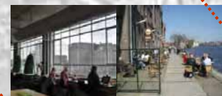
Bibliotheek en Koekfabriek