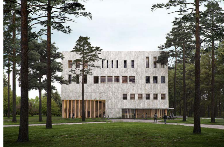
Marga Klompé Building_ architect PowerhouseCompany