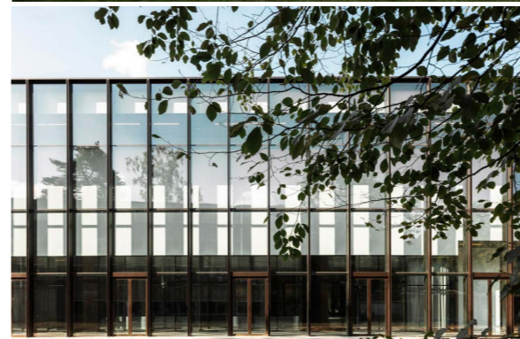
The Cube_ KAAAN Architecten