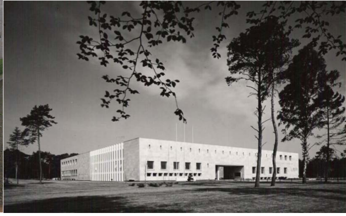
Faculty Club_ architect Hans Timmermans_ Red Dot Design award_ Staal Prijs