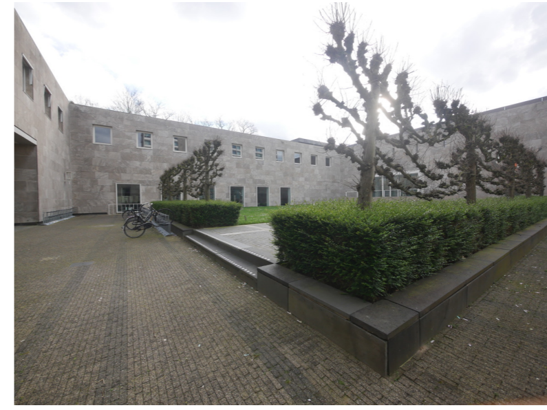
Cobbenhagengebouw_ architect Jos Bedaux_